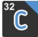
Icon der 32-Bit-Version

Die 32-Bit-Version von charly hat zur Unterscheidung zur 64-Bit-Version in dem Programm-Icon den Zusatz „32“. Die 64-Bit-Version behält das bisherige Programm-Icon.