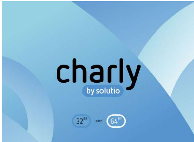
Abbildung 2 ► Start-Screen von „charly-Starter.app“

Das Programm „charly-Starter.app“ kopiert die gewählte Version lokal auf den Computer und öffnet charly direkt im Anschluss.