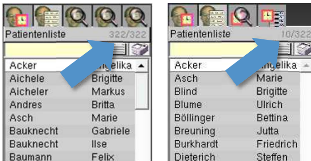
Abbildung 7 ► Neu: Die Patientenliste links enthält alle aktiven Patienten, die Patientenliste rechts enthält eine Auswahl an Patienten

Wenn die beiden Zahlen identisch sind, zeigt die Patientenliste alle Patienten (z. B. „322/322“). Wenn sich die beiden Zahlen unterscheiden , zeigt die Patientenliste eine Auswahl an Patienten (z. B. „10/322“).