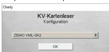
Abbildung 5 ► Konfiguration des Kartenterminals

Das Kartenterminal legen Sie in CHARLY wie gewohnt in den Stammdaten > Sonstiges > Einstellungen > Computer > Hardwareschnittstellen an und konfigurieren es auch dort. Klicken Sie dazu auf den Button Konfiguration und wählen Sie aus der Dropdownliste die Option ZEMO VML-GK2 .