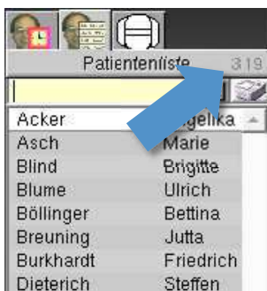
Abbildung 6 ► Alte Darstellung der Anzahl der Patienten in der Patientenliste

Damit Sie leichter erkennen können, ob die Patientenliste gerade eine Liste aller Patienten oder eine eingeschränkte Liste zeigt, wurde die Darstellung der Anzahl präzisiert. Sie wird jetzt in der Schreibweise „ x Patienten/Gesamtanzahl Patienten “ dargestellt.