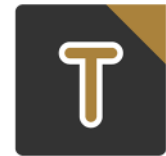
App charly Termine