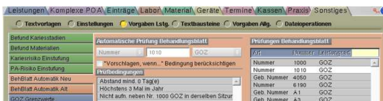
Abbildung 4 ► Konfiguration der GOZ- Plausibilitätsprüfung in BehBlatt Automatik Neu

Für die Abrechnung der privaten Prophylaxe-Leistungen können Sie die GOZ-Plausibilitätsprüfung verwenden, die sich in den Stammdaten unter Vorgaben Lstg. > BehBlatt Automatik Neu konfigurieren lässt.