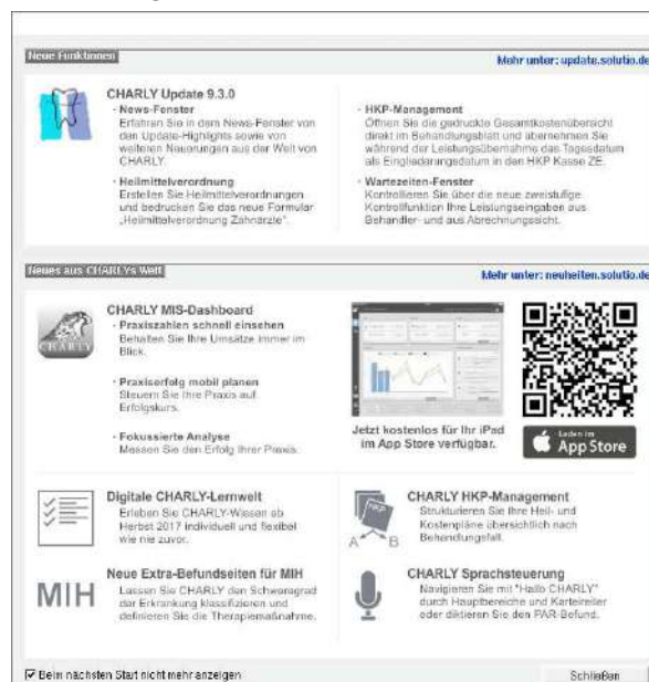
Abbildung 1 ► Neues News-Fenster

Das News-Fenster können Sie jederzeit über die Menüleiste unter Hilfe > Neuerungen aufrufen.