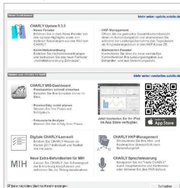
Abbildung 1 ► Neues News-Fenster

Das News-Fenster können Sie jederzeit über die Menüleiste unter Hilfe > Neuerungen aufrufen.