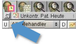
Abbildung 3 ► Filter „U“ in der „Patienten Heute“-Liste

Damit sehen Sie in der „Patienten Heute“-Liste alle Patienten, bei denen im Wartezeitenfenster